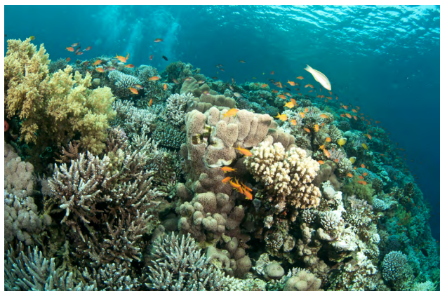
Les coraux qui bâtissent des récifs dans les mers tropicales et sub-tropicales forment leurs squelettes à partir du carbonate de calcium minéral et sont vulnérables à l'acidification.

L'augmentation rapide du niveau de \text{CO}_2 atmosphérique est une des causes principales du réchauffement climatique (+ 1 °C en moyenne). Depuis 200 ans, environ la moitié du \text{CO}_2 produit par les activités humaines a été dissoute et stockée dans les océans parce qu'ils absorbent environ un tiers du \text{CO}_2 émis chaque année. C'est une bonne chose pour le contrôle de l'effet de serre, mais cet apport supplémentaire de \text{CO}_2 dans les océans affecte leur chimie : les eaux deviennent plus acides (voir encadré 1). L'acidification des océans est donc une autre conséquence des activités humaines.